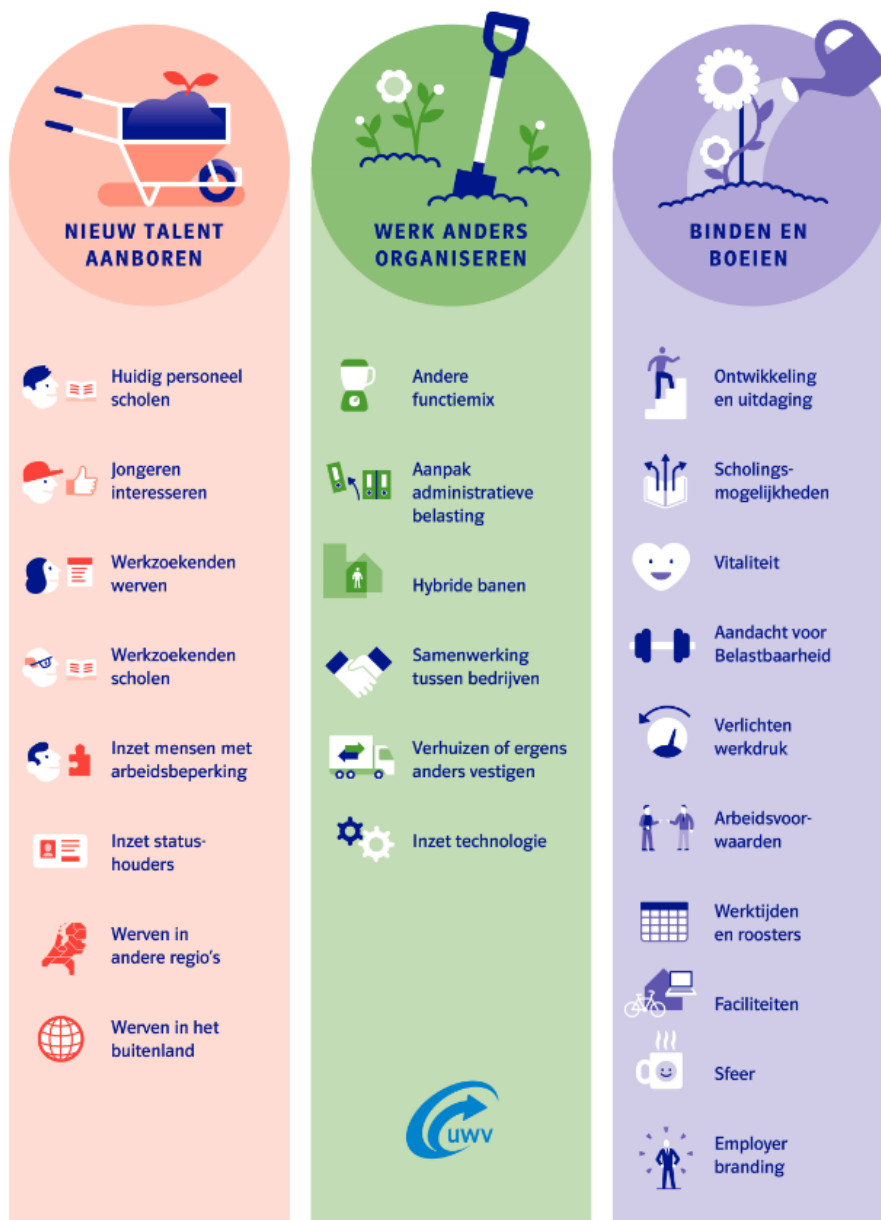
Afbeelding 6 Oplossingen personeelstekorten voor werkgevers

Samenwerking tussen werkgevers, UWV, gemeenten, onderwijs en/of andere partijen is hierbij vaak cruciaal.