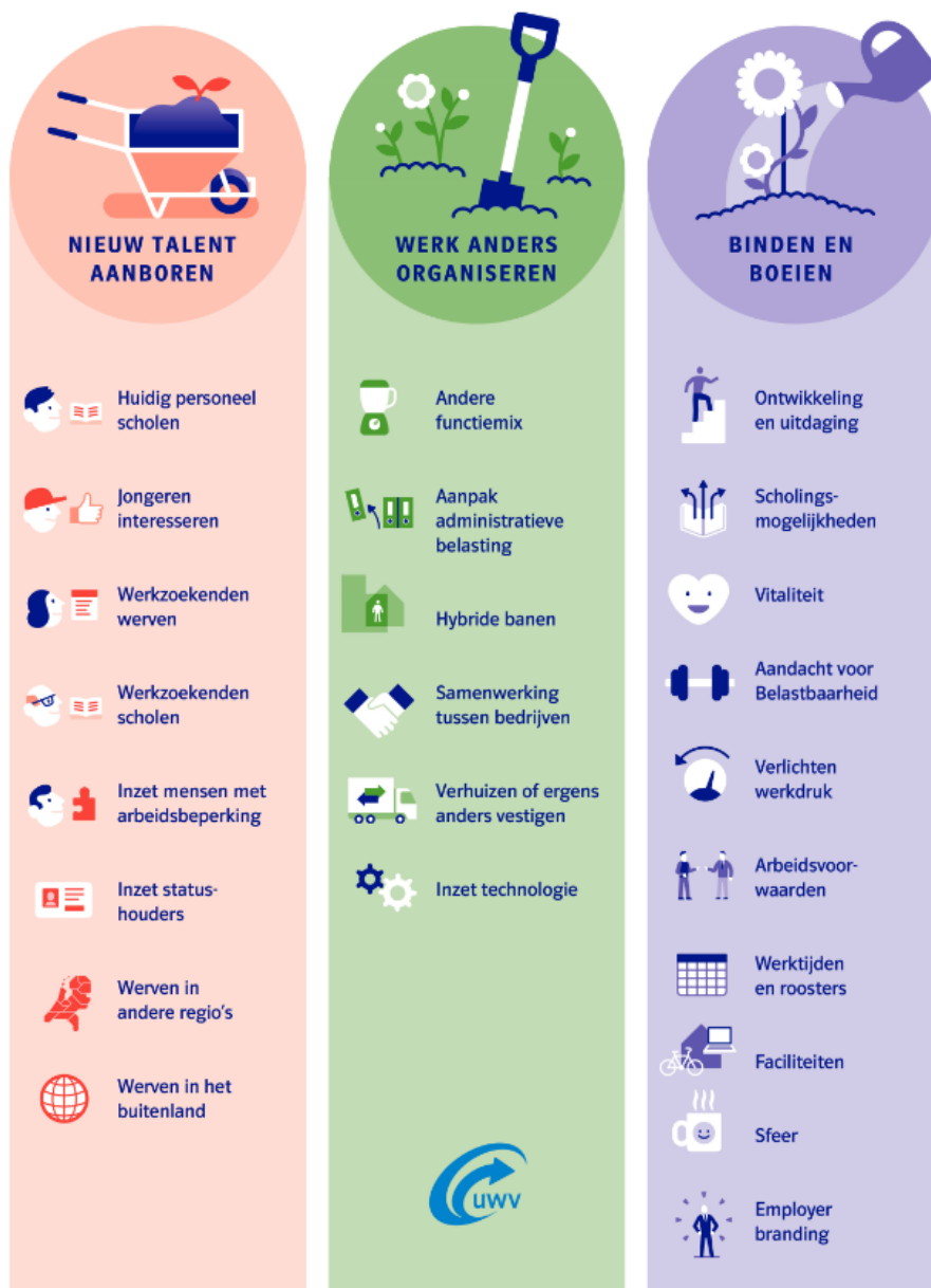
Afbeelding 6 Oplossingen personeelstekorten voor werkgevers

Samenwerking tussen werkgevers, UWV, gemeenten, onderwijs en/of andere partijen is hierbij vaak cruciaal.